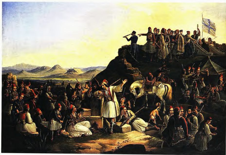
Θεόδωρος Βρυζάκης, «Το στρατόπεδο του Καραϊσκάκη», 1855 (διώρεα Πανεπιστημίου, Εθνική Πνακοθήκη - Μουσείο Αλεξάνδρου Σούτζου)

Πάνω από 1.500 επίλεκτοι πολεμιστές χάθηκαν. Είναι αξιοσημείωτο πως αυτοί που κυριολεκτικά σφαγιάστηκαν ήταν οι Κρητικοί μισθοφόροι του Κόκραν και οι Σουλιώτες που ελέγχονταν πολιτικά από τον Μαυροκορδάτο. Ο λάρδος και ο πρίγκιπας δεν είχαν κανέναν ενδοασμό να τους θυσιάσουν. Από τους Κρητικούς σκοτώθηκε ο Μ. Καλλέργης και συνελήφθη ο Δ. Καλλέργης τραυματισμένος, ενώ από τους Σουλιώτες σκοτώθηκαν οι Βέκος, Κ. Μπότζαρης, Θ. Μπότζαρης, τέσσερις Τζαβελλαίοι και ο Φωτομάρας. Νεκρός και ο Νοταράς, όπως και ο διοικητής του «τακτικού», ο συνταγματάρχης Ιγγλέσιος. Όσο για τους περίπου 250 άντρες που πιάστηκαν ζωντανά, αυτοί θανατώθηκαν με φρικτό τρόπο.