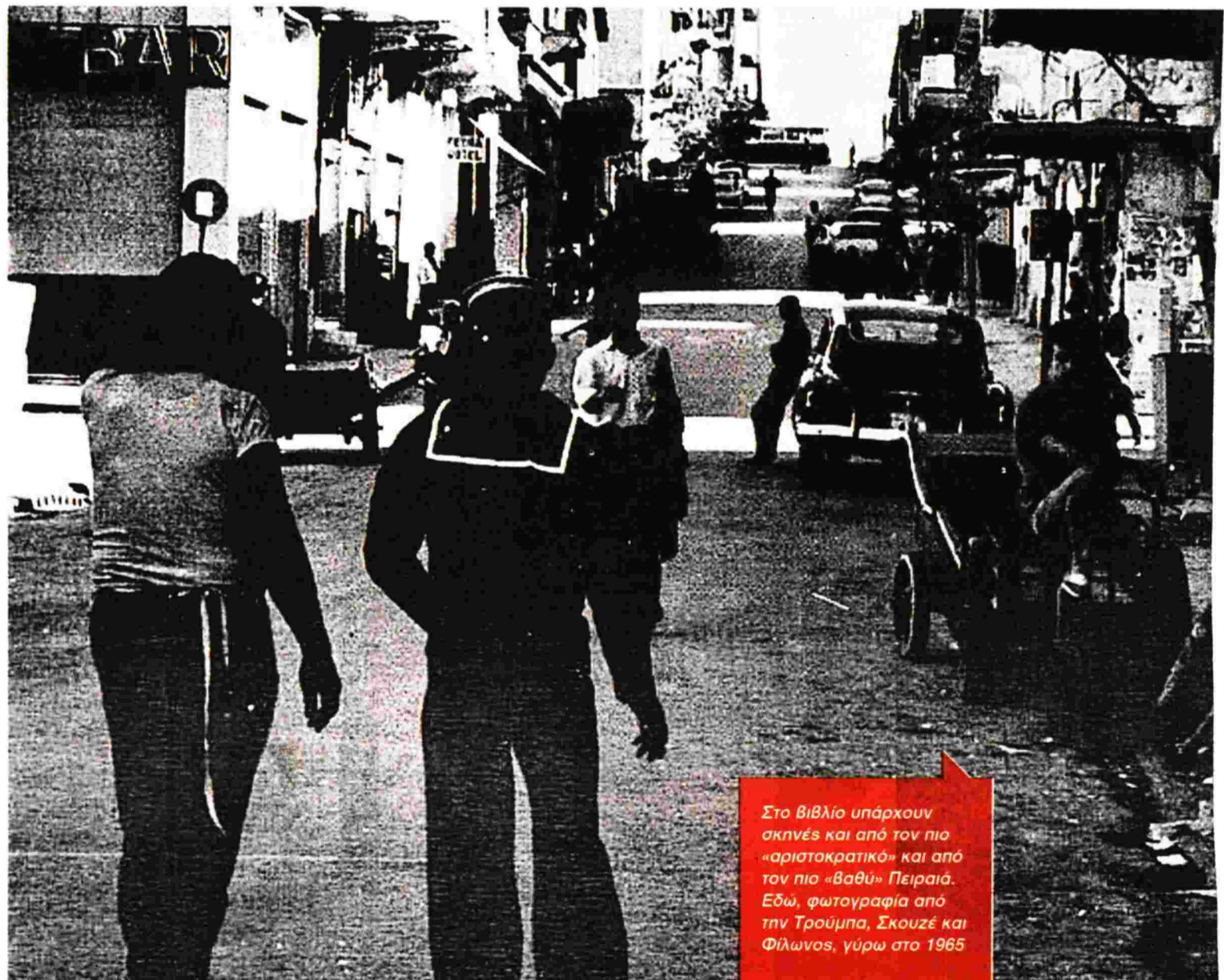
Στο βιβλίο υπάρχουν σκηνές και από τον πιο «αριστοκρατικό» και από τον πιο «βαθύ» Πειραιά. Εδώ, φωτογραφία από την Τρούμπα, Σκουζέ και Φίλωνος, γύρω στο 1965

στον μόχθο και στα πανταχού παρόντα όρια που επιβάλλει η έννοια της «τιμής». Κοντολογίς, ένας κόσμος της βιοπάλης: «Εις την ακτήν του Περάματος εξεβράσθη εκθές το πτώμα του Νικολάου Ι., ετών 40, αέργου. Εκ των ανακρίσεων του Κεντρικού Λιμεναρχείου προέκυψεν ότι επίνγη ολισθήσας εις την θάλασσαν, καθ' ην ώραν – ως εσυνήθιζεν – έπλενε την μοναδικήν του περισκελίδα» (σελ. 161). Τα ειδησάρια αυτά δεν είναι επιλεγμένα (ή κατασκευασμένα) προκειμένου να εντυπωσιαστεί ο αναγνώστης διαβάζοντας «περιέργα», «πιπεράτα» ή ορισμένες φορές αστεία περιστατικά. Αντιθέτως. Συνομιλούν με τις μικρές ιστορίες, τις συμπληρώνουν και τις αναδει-